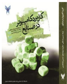
Application of Computer in Industrial Engineering F. Housheerabadi Lott G. Z. Housheerabadi M. Vazir Ghannadi

فرهاد حسین زاده لطفی، غلامرضا جهانشاهلو، محسن واعظ قاسمی انتشارات دانشگاه آزاد اسلامی واحد علوم و تحقیقات تهران شابک: ۹۷۸-۹۶۴-۲۲۳-۳۵۱-۶